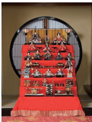
百年料亭 宇喜世のひなめぐり

◎「使っ得！にいがた県民割キャンペーン」は新潟県からの措置で、新規予約と販売を停止中で、再開は未定です。 再開される場合はツアーお申込みのお客様に連絡させていただきます。