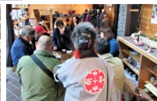
写真/左・上中央は「百年商店街 絵看板とひなめぐり」。 上右、下中央は杉田味噌造り。下右は、大杉屋惣兵衛お馬出し店で粟飴の試食。

スケジュール/百年料亭 宇喜世に11:00集合 ※地図は裏面 ■全行程、徒歩移動となります