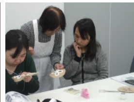
写真/上中央は、高田世界館。上右は雪が積もった旧今井染物屋。 左、下中央はバテンレース、下右はバテンレースの製作体験。