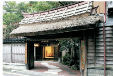
国登録有形文化財の北門

江戸時代、城下町高田から生まれた多彩な名産品、そして文化的な名所や、海の幸・山の幸が豊かなまち 上越市。