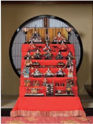
百年料亭 宇喜世のひなめぐり

※「使っ得! いいがた県民割キャンペーン」は、新潟県にお住まいの方のみご利用可能で、ワクチンを接種済であること、またはPCR検査等の検査結果が陰性であることの証明書提示が必要となります。※詳細内容は、ご旅行条件(裏面)をご確認ください。 (新型コロナウイルス感染症の感染拡大のおそれがあると県が判断した場合には、当該キャンペーンの予約・利用を停止します)